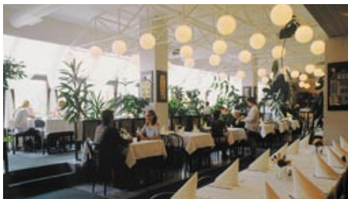
Restaurace hotelu Zálesí poskytuje hostům kvalitní „gastronomické“ zázemí, doprovázené pozorným servisem obsluhy.

Nabídka předčí očekávání „Dnes hotely „žijí“ především výsokou obsazeností ubytovacích