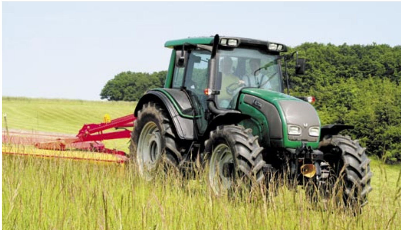
Součástí kvalitního krmiva je seno z okolních prosluněných luk. Na snímku posádka traktoru - Stanislav Zápeca a Tomáš Vacula.

turistů na naše louky a pastviny. Každou chvíli najdeme otevřené brány v oplocení. Dobytek se pak pochopitelně dostává i tam, kde není vítán a způsobí škodu. Ohlídat všech ploty ovšem v našich silách není, jen ohrad je na 170 kilometrů, “ doplňuje Aleš Svízela.